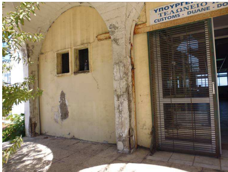
Εικόνα 6 - Πρόσοψη

Προτείνεται να αποκατασταθούν και να χρωματιστούν όλες οι προσόψεις των κτιρίων. Προτείνεται επίσης σημειακή αποκατάσταση του φέροντος οργανισμού από οπλισμένο σκυρόδεμα.