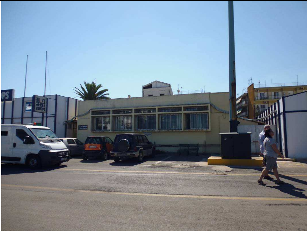
Εικόνα 3 – Πρόσψη του κτιρίου των γραφείων