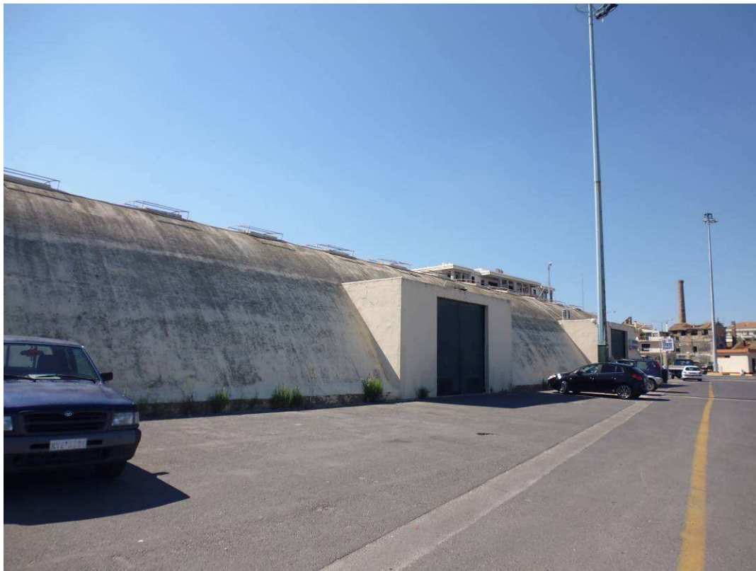
Εικόνα 4 – Πρόσψη του κτιρίου της αποθήκης