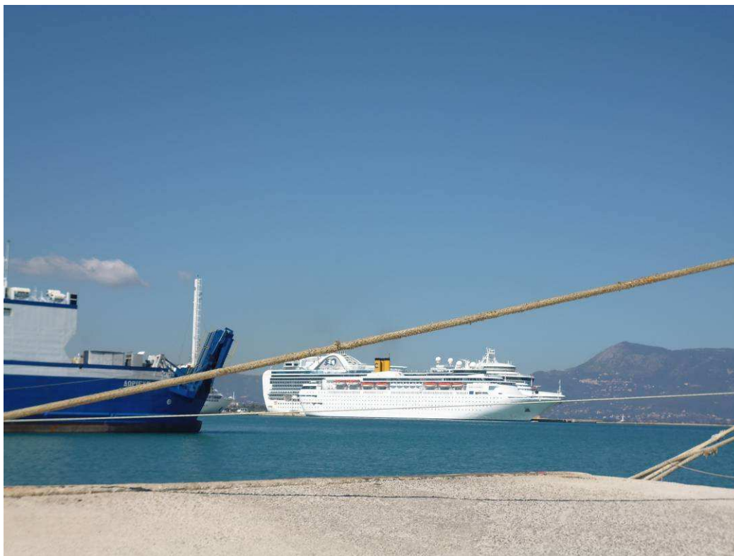
Εικόνα 5 – Λιμάνι Κέρκυρας (άποψη)

Το συγκρότημα βρίσκεται στο κέντρο του διεθνούς λιμανιού της Κέρκυρας ανάμεσα στην αποβάθρα των κρουαζιερόπλοιων και την αποβάθρα των εξωτερικών αφίξεων. Είναι ένας χώρος που επισκέπτονται τακτικά ντόπιοι και επισκέπτες, κυρίως για διοικητικές υποθέσεις. Αυτές οι λειτουργίες δημιουργούν έναν χώρο που αποτελεί σημαντικό πόλο έλξης για την εξωτερική πολιτική και την τοπική μεταφορά εμπορευμάτων.