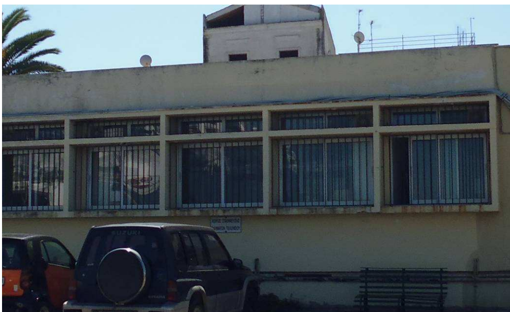
Εικόνα 8 – Κτίριο τελωνείου (παράθυρα)

Προτείνεται να αντικατασταθούν όλες τις πόρτες και τα παράθυρα στο κεντρικό κτίριο.