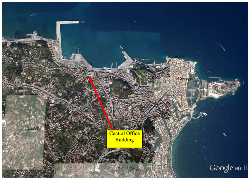
Δορυφορική λήψη 1 – Αεροφωτογραφία του κτιρίου του τελωνείου και της ευρύτερης περιοχής