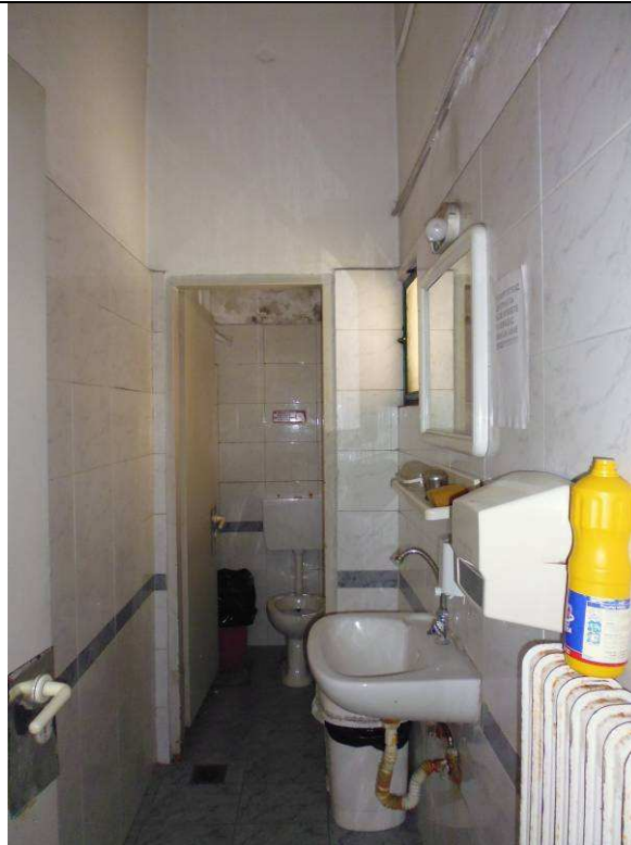
Εικόνα 7 - WC