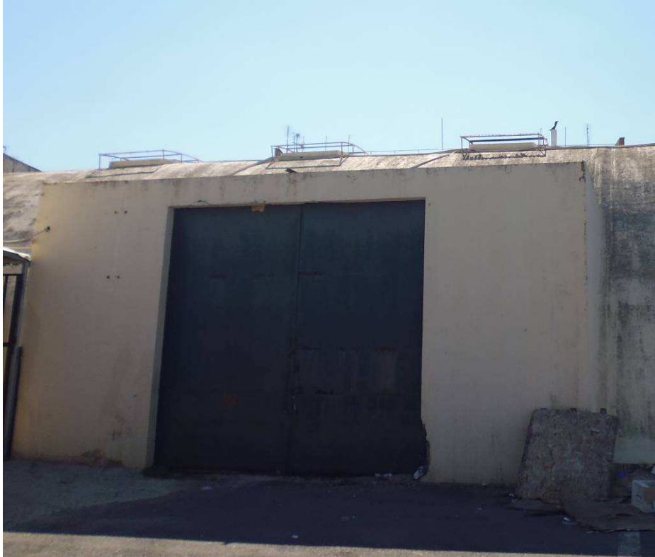
Εικόνα 9 – Είσοδος αποθήκης

Πρόκειται για σποραδικές επισκευαστικές εργασίες (π.χ. χρωματισμοί, επισκευές επιχρισμάτων κλπ).