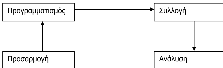
Σχήμα 1: Το πρότυπο των τεσσάρων φάσεων

υπηρεσία από την άλλη. Κυρίαρχο στοιχείο στην προκειμένη περίπτωση είναι εξάλλου το γεγονός αποφυγής μηχανιστικών μιμήσεων όπως και η μεταφορά μεθόδων και τρόπων υλοποίησης που ισχύουν στις ιδιωτικές επιχειρήσεις στο πεδίο δράσης των δημοσίων υπηρεσιών. Από την άλλη πλευρά η παραπάνω παρατήρηση δεν θα πρέπει να εκλαμβάνεται ως παράγοντας ενεργοποίησης δράσεων, πρωτοβουλιών και σχεδιασμού έργων (projects) για την ανακάλυψη πάντοτε μιας μεθοδολογία. Οι κύριες φάσεις, τα βασικά στάδια υλοποίησης της τεχνικής των συγκριτικών επιδόσεων θα πρέπει να θεωρούνται ως δεδομένες, ανεξάρτητα του χρόνου ή του χώρου υλοποίησης. Με άλλα λόγια, ανεξάρτητα του είδους των συγκριτικών επιδόσεων που υιοθετείται, οι συστατικές δράσεις που θα πρέπει να αναληφθούν κατά την υλοποίηση των συγκριτικών επιδόσεων θα πρέπει να ακολουθούν την ίδια ροή ή σειρά όπως απεικονίζεται στο ακόλουθο σχήμα: