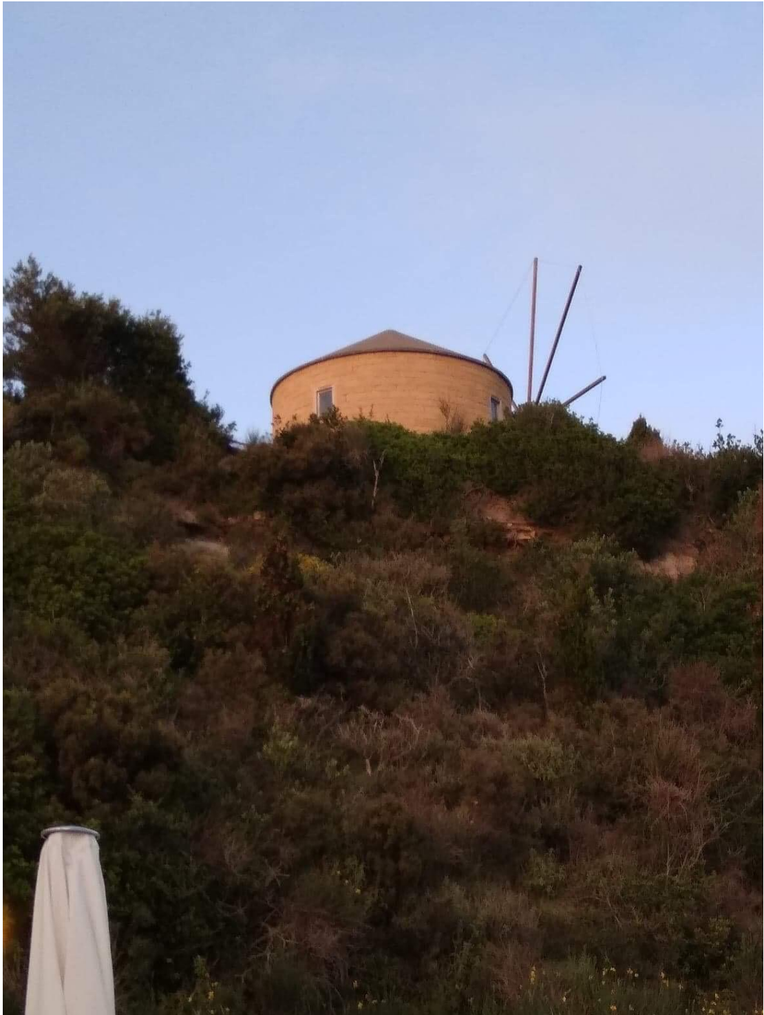
"πνελιές" από τη μαγεία των νησιών

Ο ΑΝΤΙΠΕΡΙΦΕΡΕΙΑΡΧΗΣ ΤΟΥΡΙΣΜΟΥ ΚΑΙ ΝΗΣΙΩΤΙΚΗΣ ΠΟΛΙΤΙΚΗΣ ΣΠΥΡΟΣ ΓΑΛΙΑΤΣΑΤΟΣ