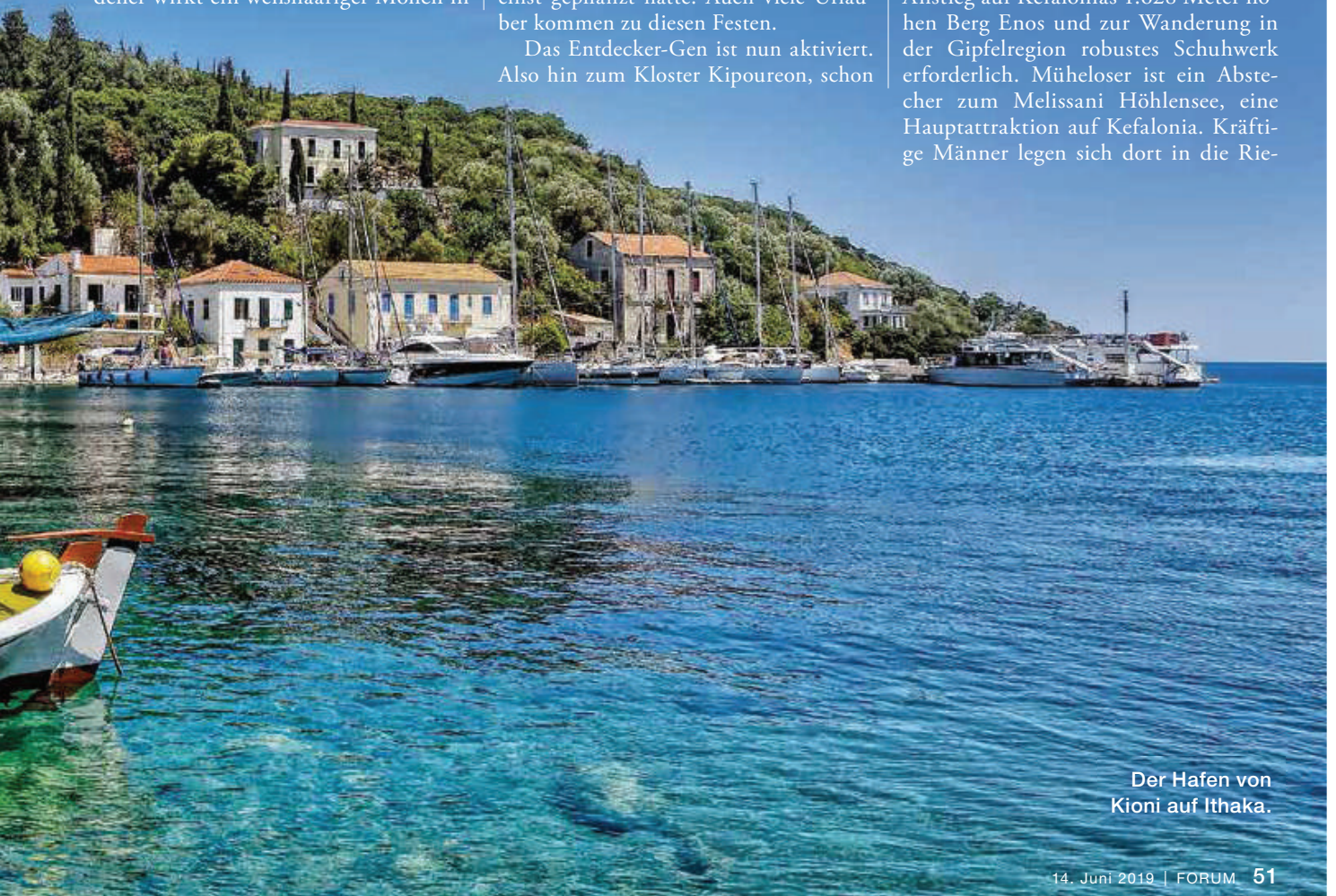
Der Hafen von Kioni auf Ithaka.

Statt Walzer in High Heels ist zum Anstieg auf Kefalonias 1.628 Meter hohen Berg Enos und zur Wanderung in der Gipfelregion robustes Schuhwerk erforderlich. Müheloser ist ein Absteher zum Melissani Höhlensee, eine Hauptattraktion auf Kefalonia. Kräftige Männer legen sich dort in die Rie-