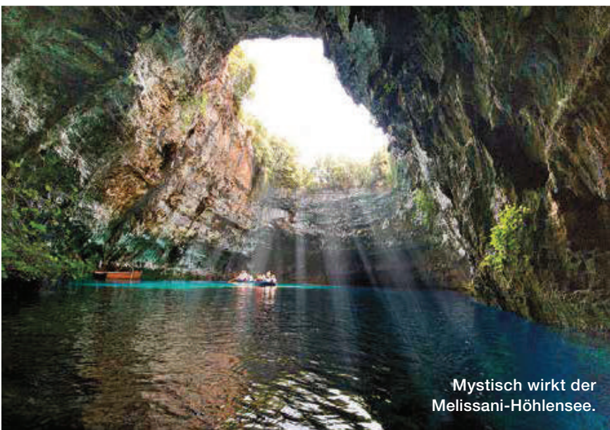
Mystisch wirkt der Melissani-Höhlensee.

men und rudern die Passagiere, Erklärungen und Gesang inklusive, über das tiefblau bis türkis glitzernde Wasser. Ein Kurztrip auf diesem Naturwunder.