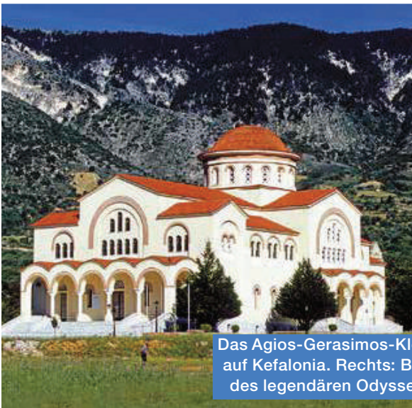
Das Agios-Gerasimos-Kloster auf Kefalonia. Rechts: Büste des legendären Odysseus.