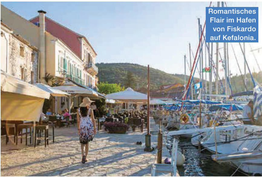
Romantisches Flair im Hafen von Fiskardo auf Kefalonia.