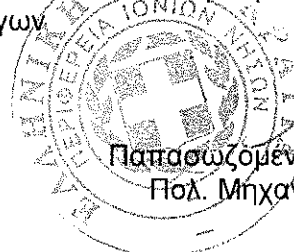
Παπασωζομένου Χρυστάλλα Πολ. Μηχανικός ΠΕ/Α'