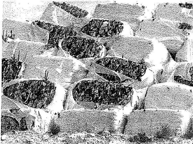
Εικόνα 2. Διερρηγμένα δέρματα