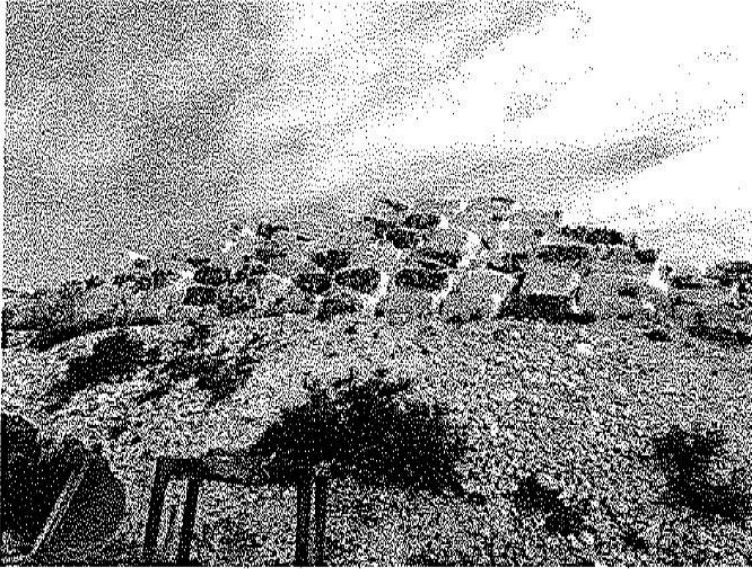
Εικόνα 3. Διεσπασμένα δέματα