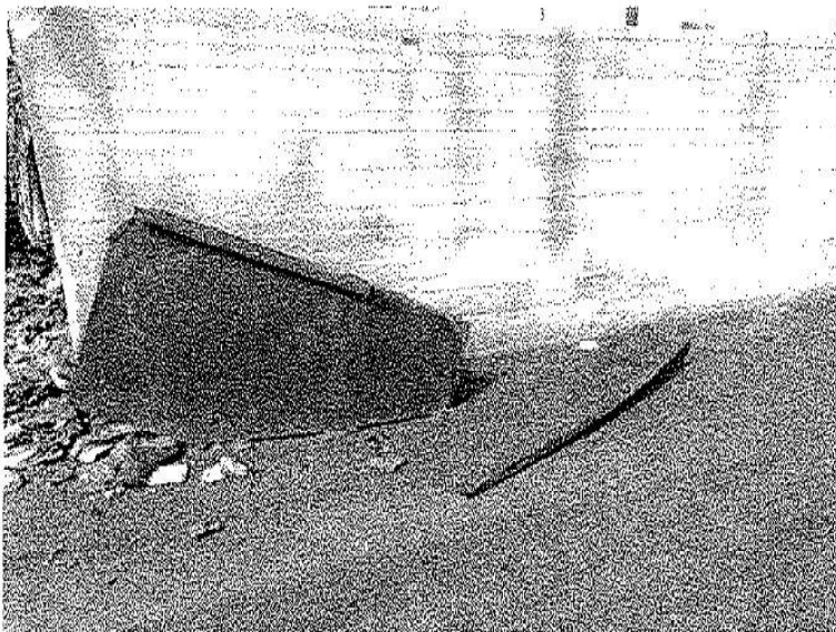
Εικόνα 4. Αποκόλληση μεταλλικών τμημάτων