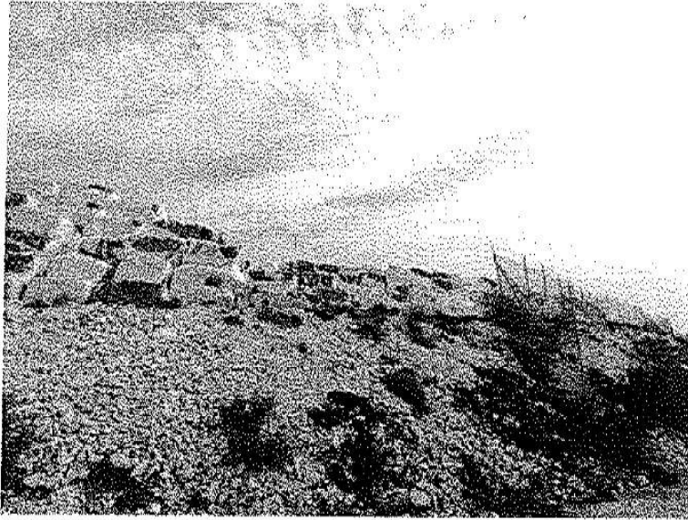
Εικόνα 5. Κατστραμμένο τμήμα περίφραξης