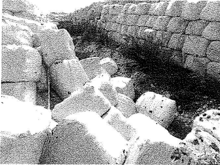
Εικόνα 1. Κατάπτωση δερμάτων