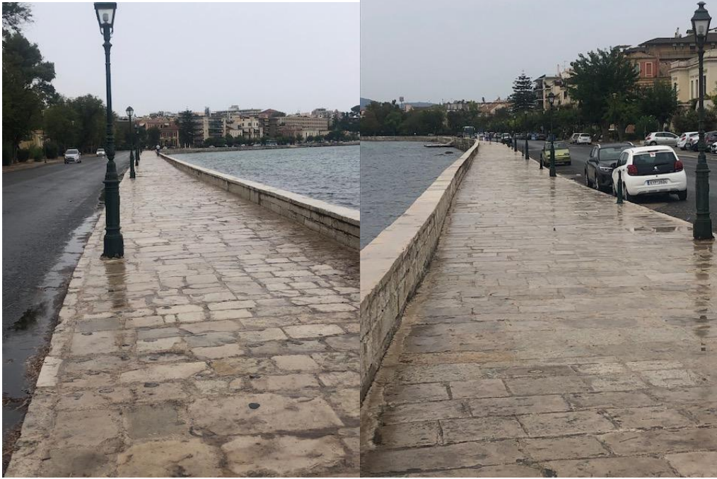
Γαρίτσα – ΠΙΝ/ΑΝΑΣΑ

Με την ευκαιρία, σας δείχνουμε και την εικόνα του έργου της ΠΙΝ/ΑΝΑΣΑ στο σημείο: