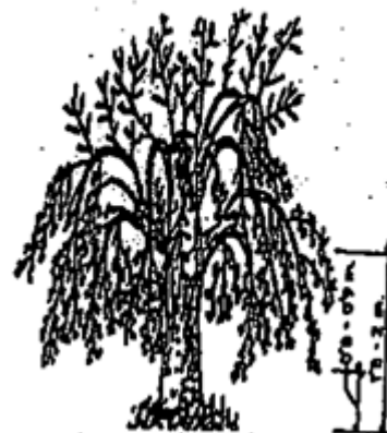
ΣΧΗΜΑ Δ: μετά από 4-5 χρόνια