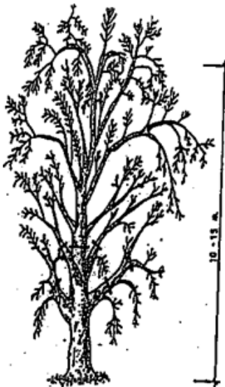
ΣΧΗΜΑ Α: πριν το κλάδεμα

Ένα με δύο χρόνια μετά το κλάδεμα ανανέωσης δεν ρίχνουμε καθόλου λίπασμα. Όλες οι παραπάνω εργασίες γίνονται σε μέρες που δεν βρέχει, έτσι ώστε να αποφύγουμε προσβολή από ασθένειες.