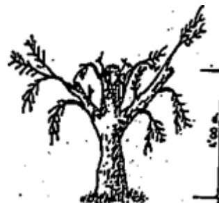
ΣΧΗΜΑ Β: αμέσως μετά το κλάδεμα