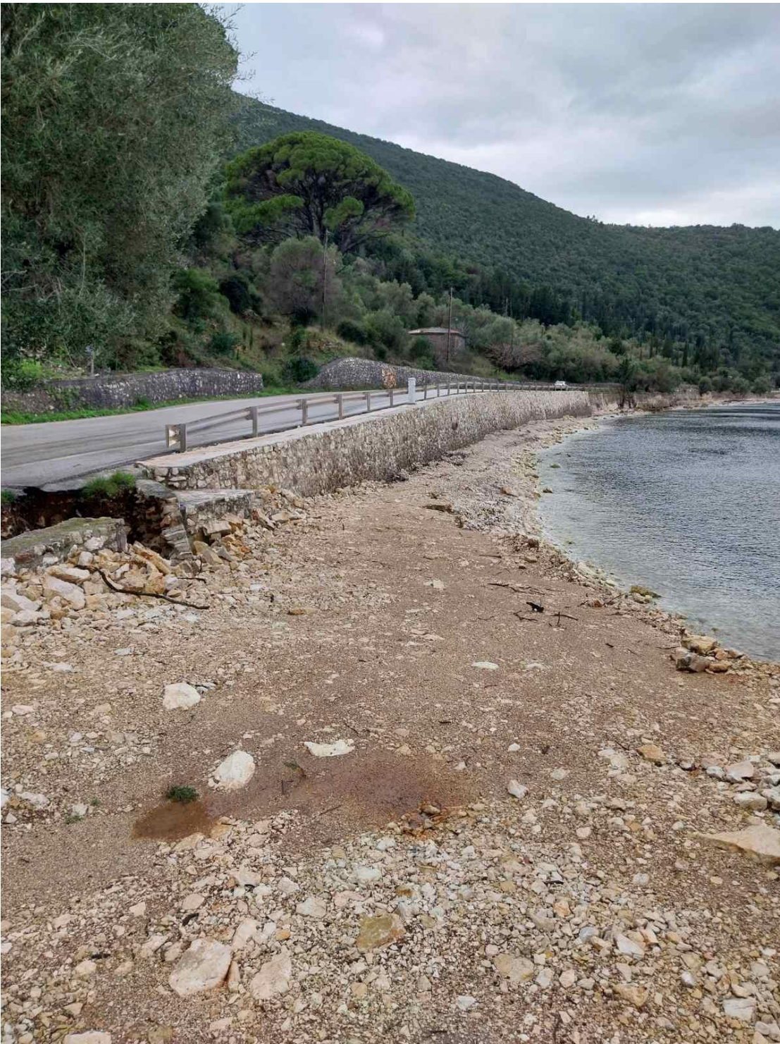
Η πραγματικότητα σήμερα (photo 15.02.2025)